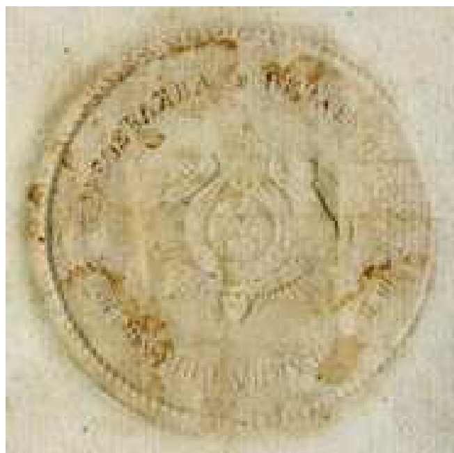
Оттиски печатей (бумажные кустодии) орденов Св. Александра Невского и Св. Андрея Первозванного.