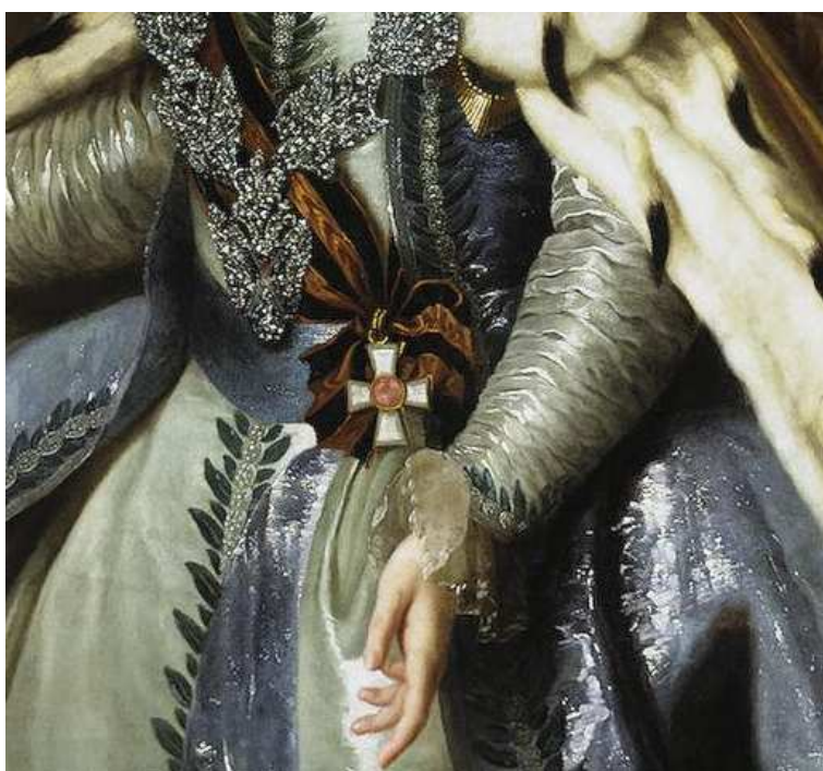
Федор Рокотов, Портрет Екатерины II. ок. 1770 г. Государственный Эрмитаж.

Значительно менее известен герб ордена, используемый, в частности, на орденской печати. Герб представляет собой черный щит в котором два золотых столба (расцветка орденской ленты), поверх которых знак Военного Ордена Св. Великомученика и Победоносца Георгия. Щит увенчан императорской короной и наложен на четырехугольную орденскую звезду, которая вверху окружена лавровой ветвью, перевязанной лентой с девизом «ЗА СЛУЖБУ И ХРАБРОСТЬ».