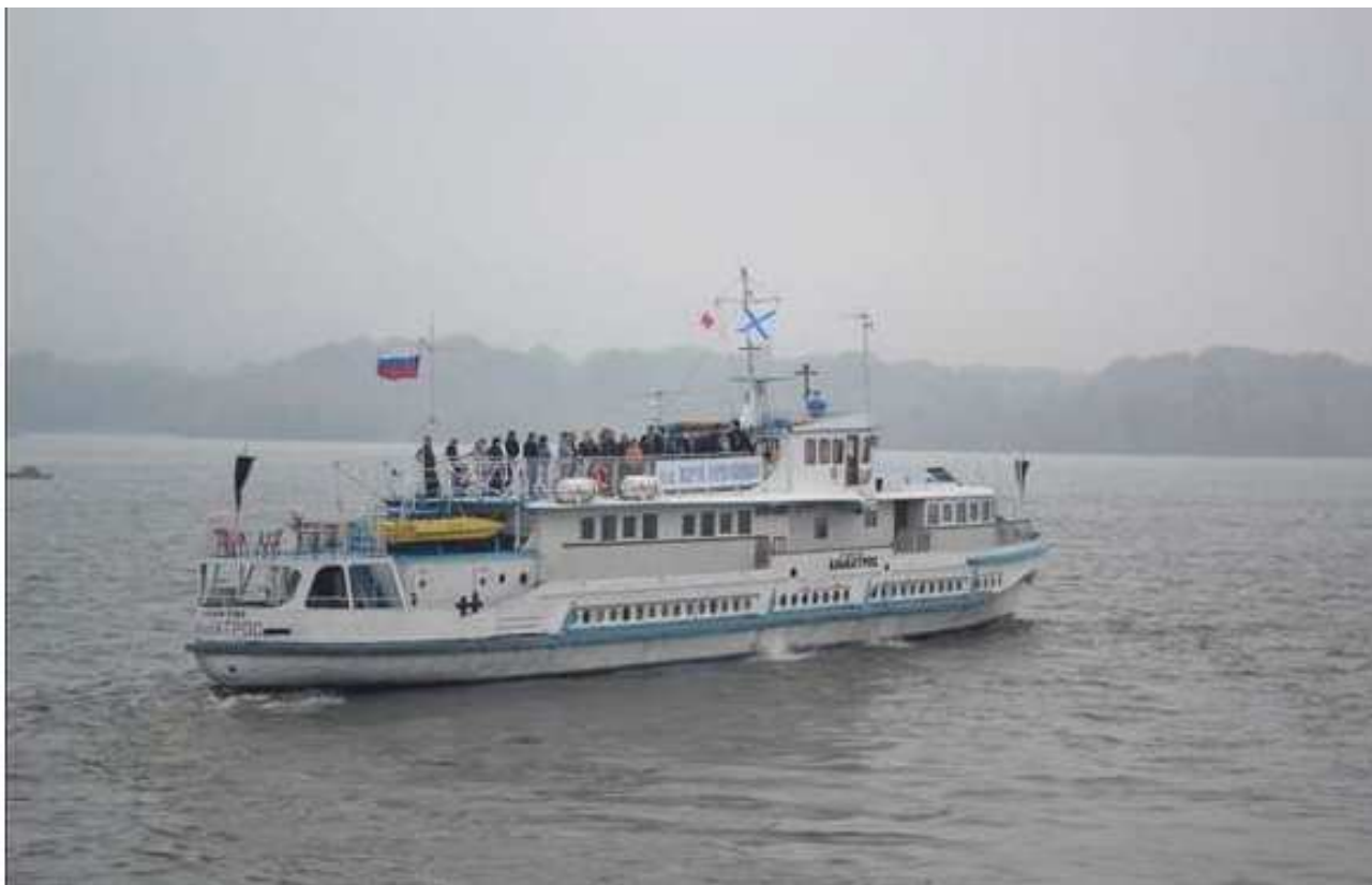
Корабль-церковь «Святой апостол Андрей Первозванный» под флагами. На сигнальных фалах флаг Красного креста и андреевский флаг. Фото 2013 г.

Летом 2013 года в такой благотворительный рейс под именем «корабль-церковь «Святой апостол Андрей Первозванный» вышел теплоход «Альбатрос» федерального государственного образовательного учреждения высшего профессионального образования «Новосибирская Государственная академия водного транспорта» (ФГОУ ВПО Новосибирская ГАВТ).