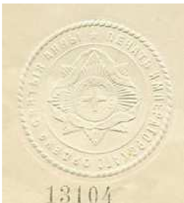
Оттиски печатей (бумажные кустодии) орденов Св. Станислава и Св. Анны