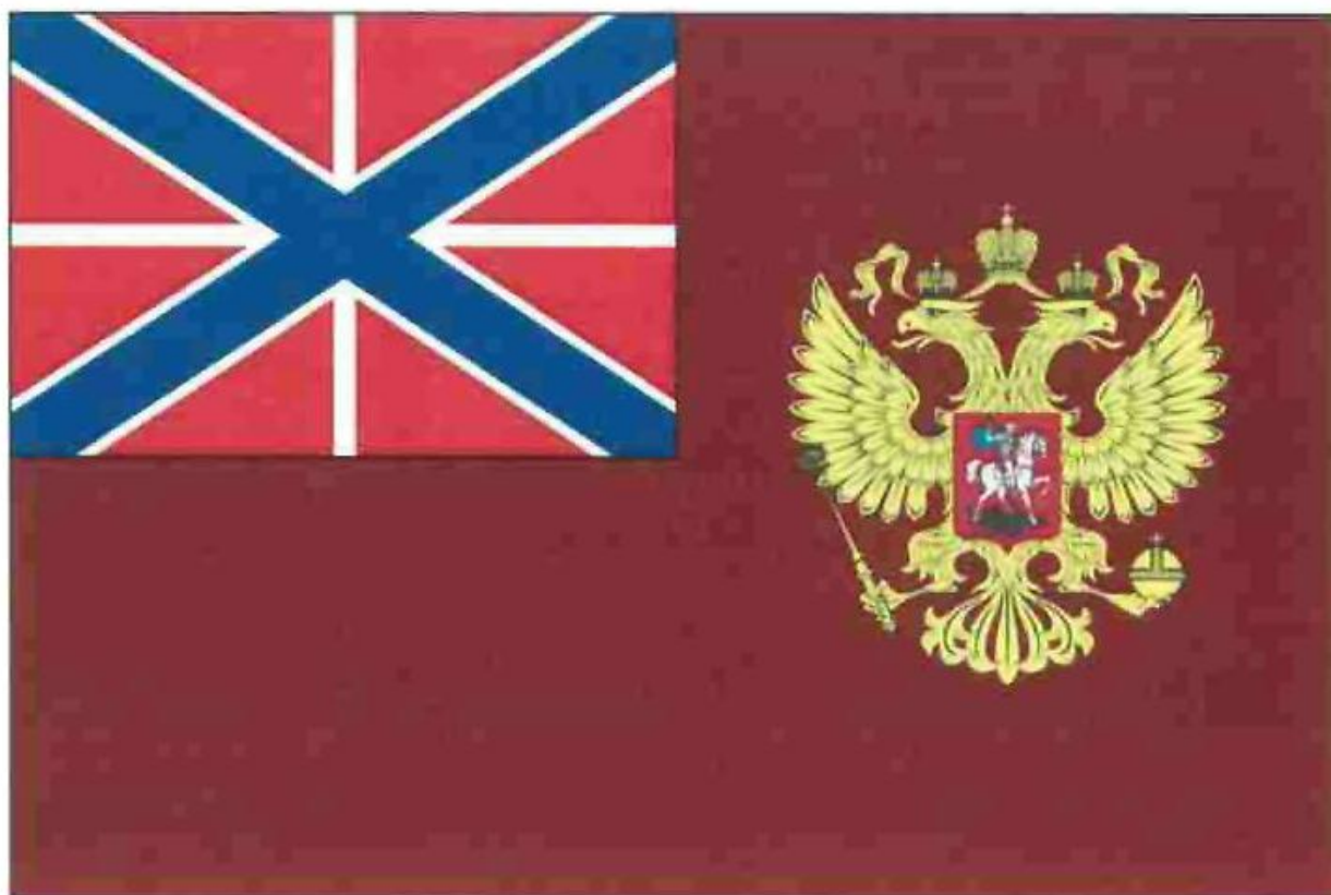
Рисунок флага директора Федеральной службы войск национальной гвардии Российской Федерации - главнокомандующего войсками национальной гвардии Российской Федерации

УТВЕРЖДЕНО Указом Президента Российской Федерации от 30 декабря 2019 г. N 637