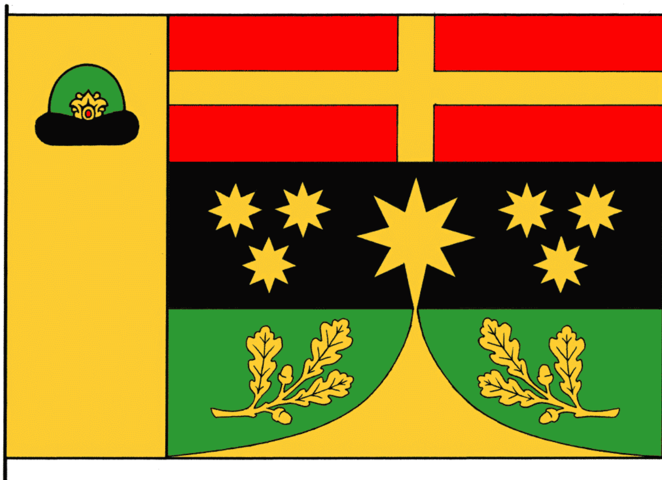
Цветное изображение флага