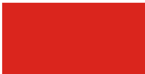
Рис. 1. Флаг дардара Таджики