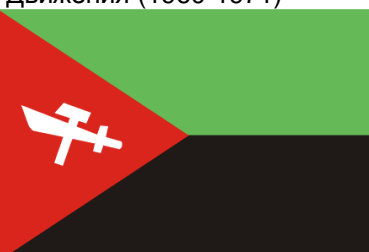
Рис. 7. Флаг Национального Союза за независимость