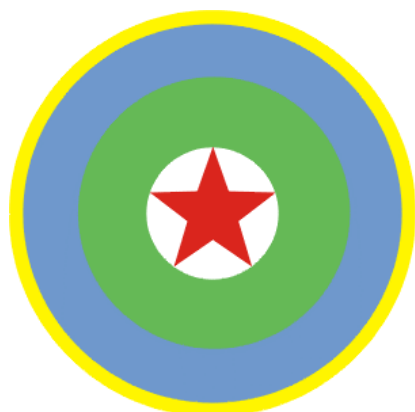
Рис. 9. Эмблема-кокарда

Национальная эмблема была создана художником Хассаном Робле и имеет в основе изображение традиционного местного круглого щита,