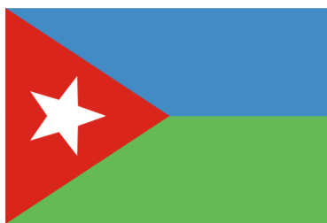
Рис.4. Флаг Движения за республиканский союз (1957-1959)

-Флаг Фронта освобождения Берега сомалийцев (с 1960) -Флаг Партии народного Движения (1960-1971)