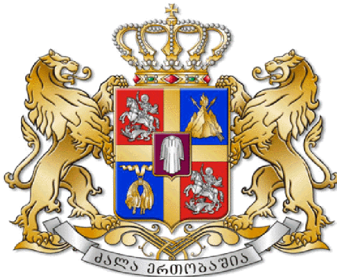
Новый герб Грузии ( проект)

In May, 2003 project of new coat of arms of Georgia were presented in Parliament in Tbilisi.