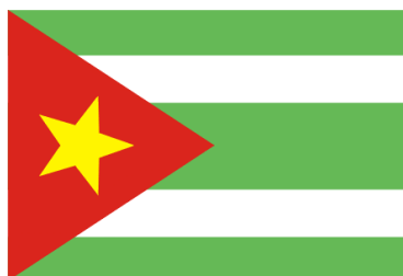
Рис. 5. Флаг Афарского демократического союза

-Флаг Фронта освобождения Берега сомалийцев (с 1960) -Флаг Партии народного Движения (1960-1971)