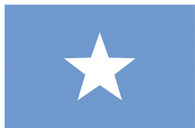
Рис. 3. Флаг Сомали