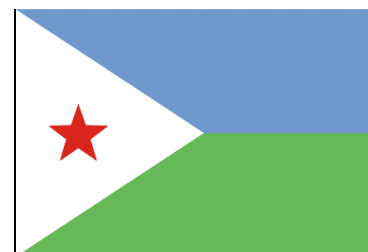
Рис 8. Национальный флаг Джибути